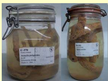
Δείγματα της συλλογής των σπόγγων του Μουσείου Ζωολογίας του Τμήματος Βιολογίας Α.Π.Θ.

Η συλλογή θα μπορούσε να συμμετέχει σε ευρύτερη έκθεση του Μουσείου, ανοιχτή στο κοινό και σε ομάδες μαθητών και φοιτητών, με έντυπο εκπαιδευτικό υλικό, φωτογραφίες, βίντεο, διάλεξη καθώς και παρουσίαση δειγμάτων σπόγγων. Μια τέτοια δράση θα προβάλλει το έργο του Πανεπιστημίου και θα συμβάλλει στην ενημέρωση και ευαισθητοποίηση του κοινού για τον πλούτο της ζωής των ελληνικών θαλασσών.