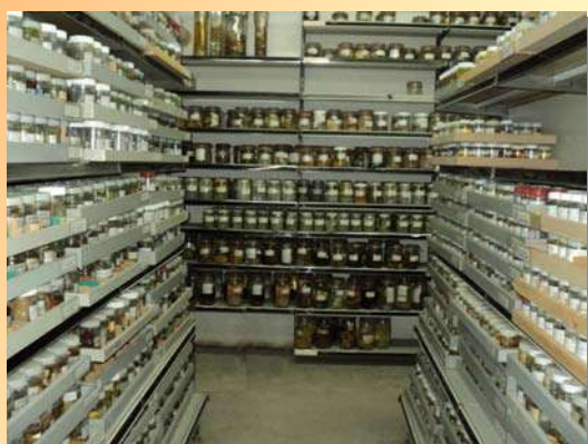
Χώρος συλλογής στο Μουσείο Ζωολογίας του Τμήματος Βιολογίας Α.Π.Θ.

Η εφαρμογή οργανωμένων εκπαιδευτικών προγραμμάτων από τα μουσεία προσφέρει μια ελεύθερη μη αξιολογούμενη μορφή εκπαίδευσης που συμβάλλει στην ανάπτυξη μιας διαρκούς σχέσης με την επιστήμη που εκτείνεται πέρα από μια επίσκεψη στο μουσείο.